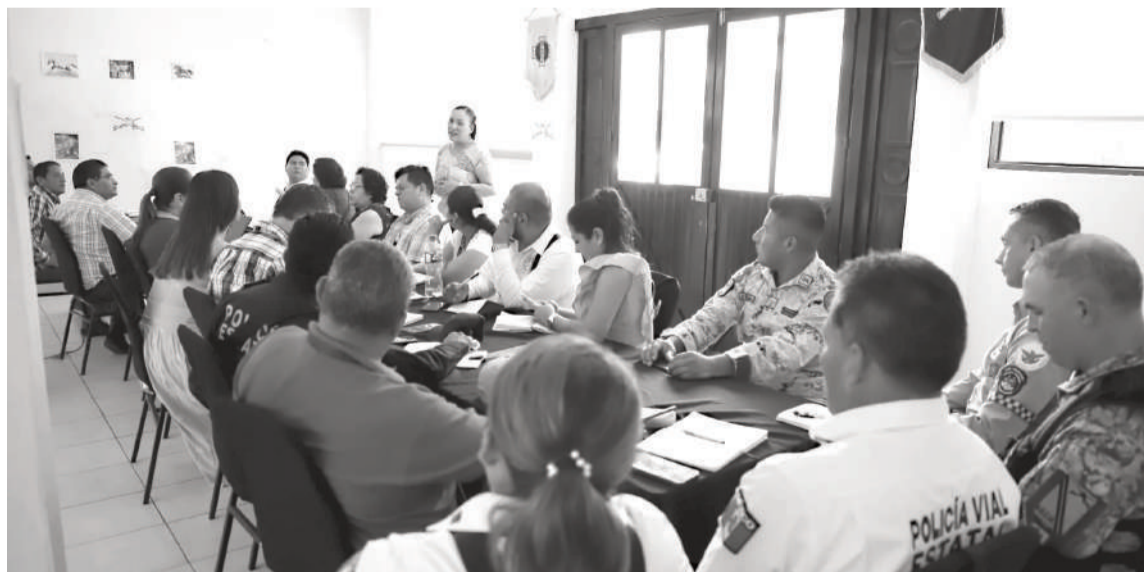
El 11 de abril se instaló la MOSE en Tuxtepec.

La primera mesa se instaló el 10 de abril en San Pedro Mixtepec con el objetivo de brindar atención a los municipios integrantes del Distrito Electoral Federal con sede en Puerto