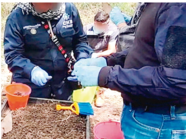
Trascendió que varias fosas clandestinas fueron ubicadas en Loma Bonita.