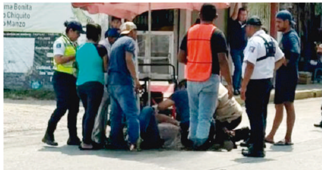
Una persona del sexo masculino fue arrollado cerca del parque de La Piragua.