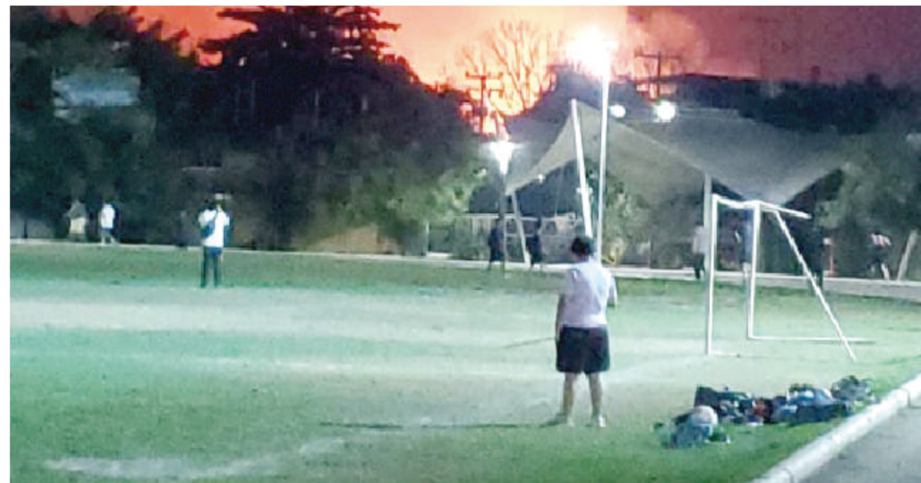
Impresionante imagen del incendio registrado la tarde del jueves en Tuxtepec.

se dijo la gravedad de sus lesiones, que al parecer no fueron de las consideradas como graves o de riesgo para su salud, tampoco se dijo quién y que vehículo lo había impactado.