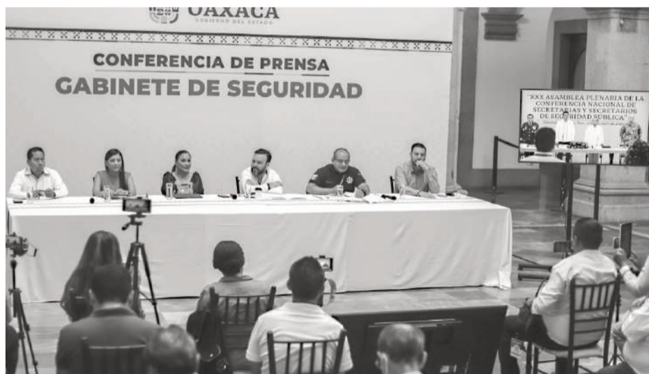
Gabinete de Seguridad en conferencia de prensa.

Asimismo, se confiscaron ocho armas, 44 municiones y tres cargadores; y se aseguraron 103 dosis de