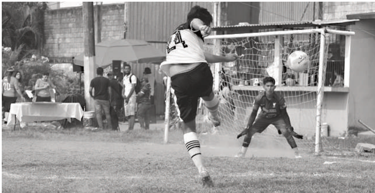
Mucha actividad este domingo en la Liga de Fútbol 7 Extramuros.

contra Potros Noticias, 09:00 FC Troncos frente Espartanos Jr, 10:20 La Gambeta FC ante Spartans FC, 11:30 Deportivo Tuxtepec contra Catarino Torres, 15:00 FC Sandy-as frente Retorno FC, 16:10 Halcones Dorados ante Paraíso FC, 17:10 horas Deportivo Ocampo ante FC Borregos.