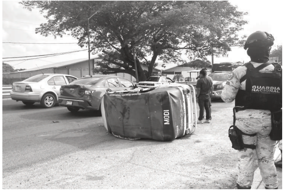
El mototaxi chocó contra el KIA y volcó; aseguran que el mototaxista se encontraba en estado de ebriedad.