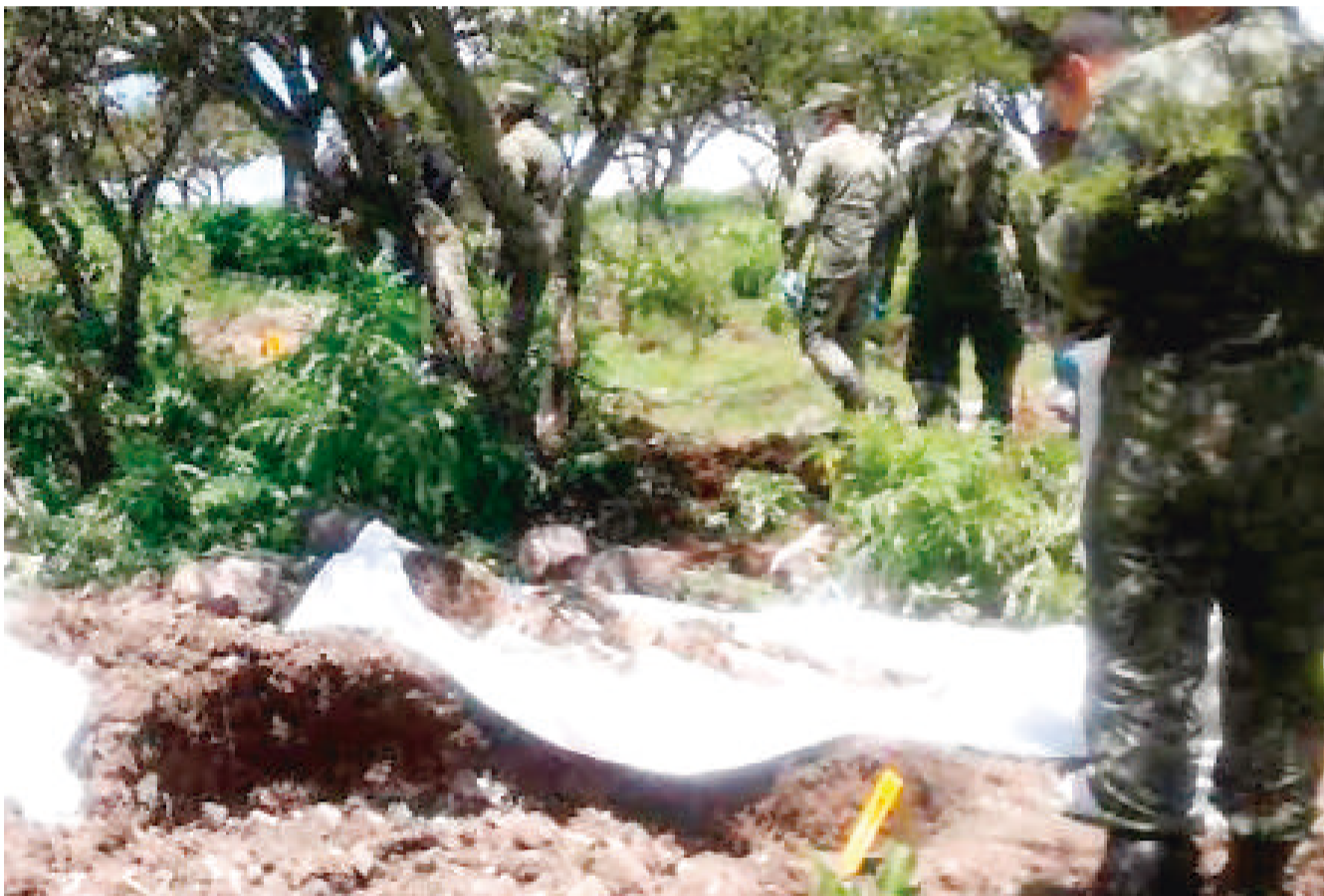
Hasta el momento la información se mantiene como rumor.

Según las fuentes que manejan esta información de forma extraoficial, el operativo de búsqueda de las fosas clandestinas, se habría realizado después de que se realizaran denuncias anónimas