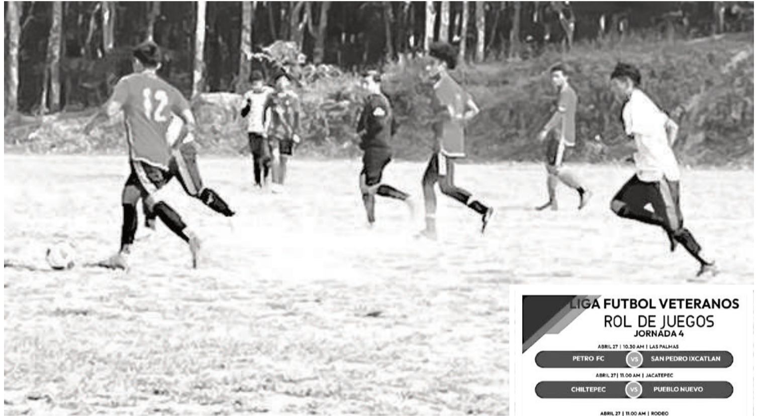
Diez partidos se juegan este domingo en la Liga Ejidal de Fútbol.

La jornada completa inicia en punto de las 11:15 horas cuando el equipo de Camelia Roja reciba la visita de la escuadra del Buenos Aires, mientras que a las 14:00 horas Paso Canoa será anfitrión en su terreno ante Arroyo Chiquito, en tanto que a las 15:00 horas en el campo "La Playa" el equipo de Camarón enfrenta a La Esperanza.