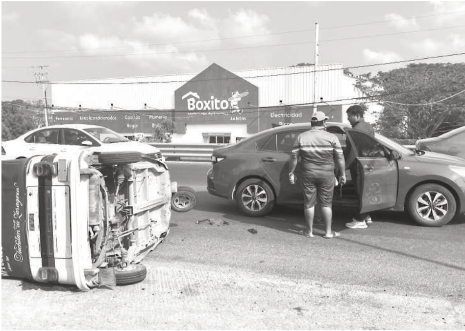
Los pasajeros del mototaxi resultaron lesionados, pero se retiraron del lugar.