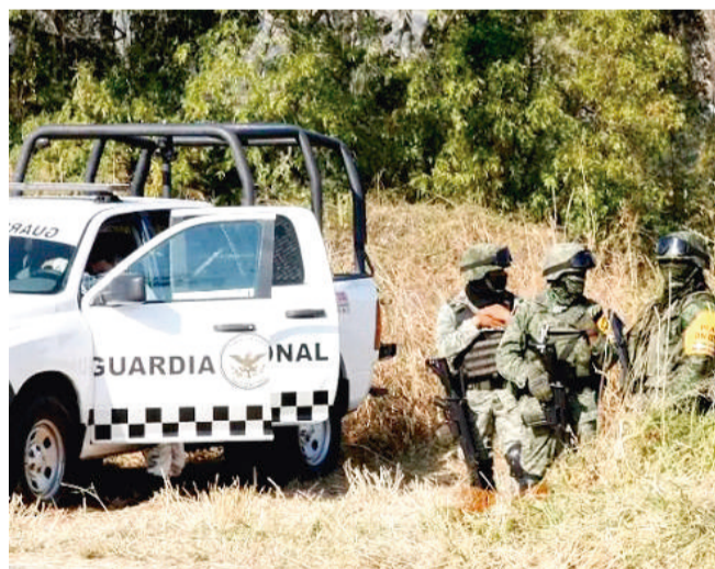
Se espera que las autoridades informen o desmientan estos sucesos.

por parte de ciudadanos, que alertaron la presencia de cuerpos humanos dentro de las fosas.