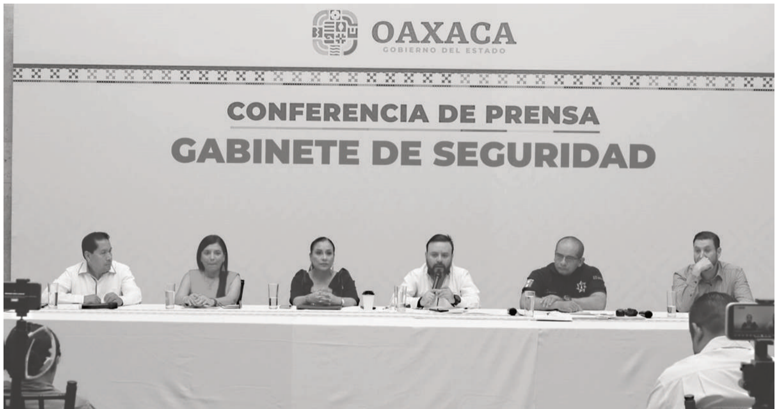
De diciembre de 2022 a la fecha se han solucionado 23 conflictos territoriales.