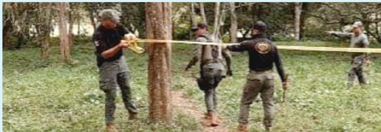
Imagen del predio en donde habrían sido encontrados los cuerpos.