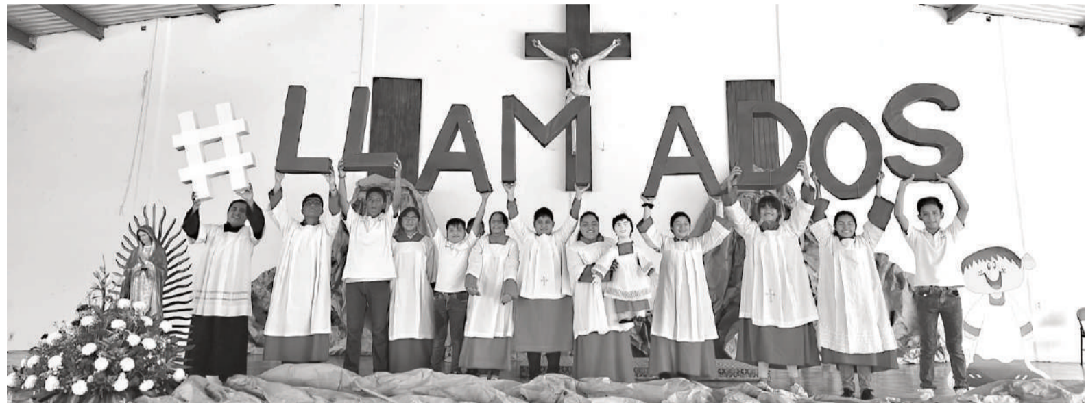
Se realizará en la casa de la iglesia.

El encuentro se llevará a cabo el próximo cuatro de mayo a partir de las nueve de la mañana y hasta las dos de la tarde, durante